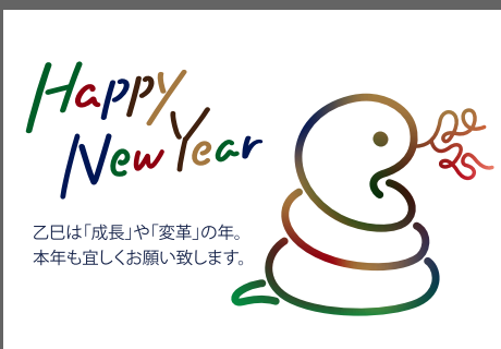
映像 三宅 直子