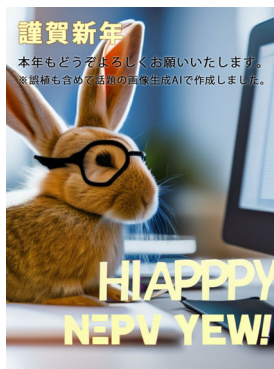
WEB 鮎川 絢一