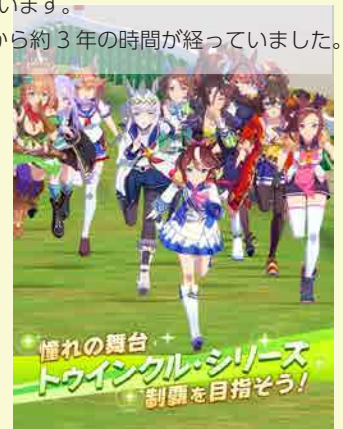
記事：顔認識チーム 佐藤成

ここ数年、競馬は女性ファンの獲得に成功して、コロナ禍でも売り上げ好調。「ウマ娘」の影響により今年も更にファンが増えるのかもしれない。私も今年は競馬場に行ってみたいなと思っています。