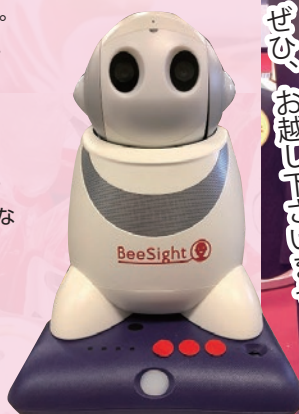
PaPelo i です!