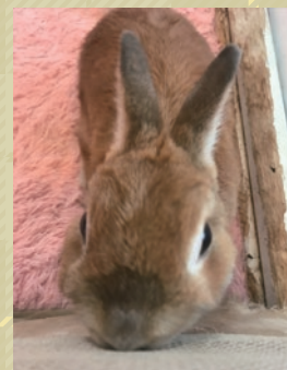
元気なネザーランドドワーフ プリッツくん