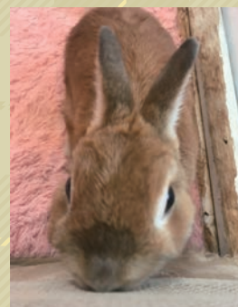
元気なネザーランドドワーフ ブリックくん

東京都渋谷区神宮前 6-14-15 メゾン原宿 3F https://raagf.com/ 60分 1100円(小学生 900円)