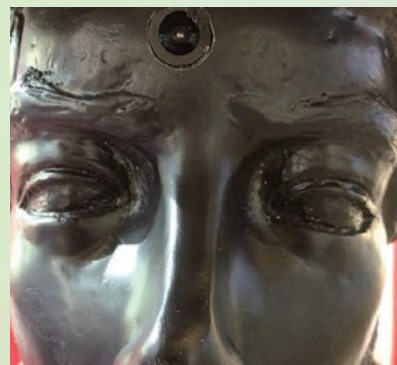
展示予定のマネキン♪