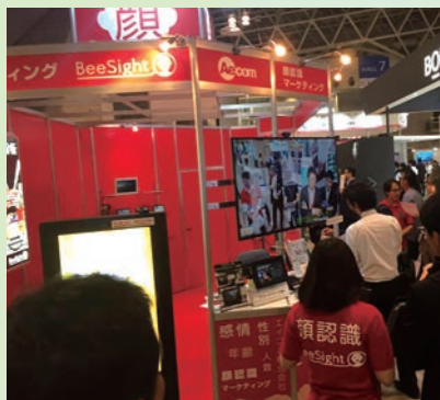
前回の展示会の様子