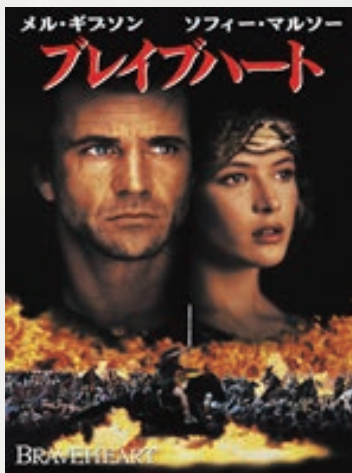
アカデミー作品賞、アカデミー監督賞、 アカデミー撮影賞、その他受賞